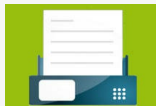
Par télécopie (fax)