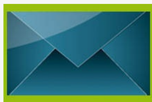
Par courrier postal