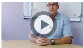
Généralisation du téléservice TDSHF