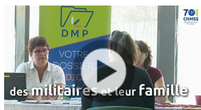
"Mercredi de Ste-Anne" La CNMSS à la rencontre des familles