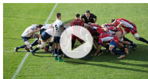
"Crunch 2018" : rugby en faveur des blessés des armées