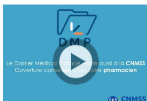
Pratique et sécurisé le Dossier médical partagé