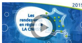
Rendez-vous en Région 2019 : dernières étapes