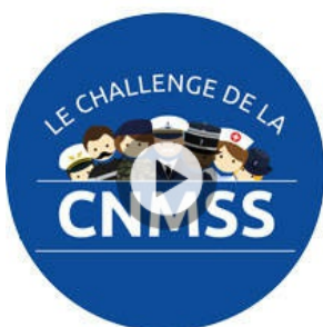
Le challenge de la CNMSS - 70 ans