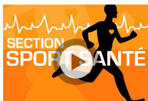
"Sport sur ordonnance" au CSLG de Bordeaux