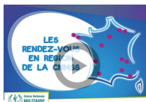
« Rendez-vous en région » 2018 : tout commence le 5 juin