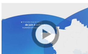
Nouveau Départ des rendez-vous en région - Edition 2019