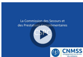
La commission des secours et des prestations complémentaires