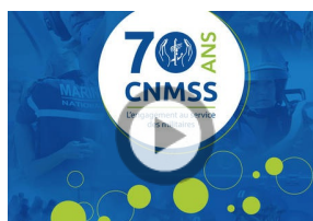
1949-2019 70 ans de la CNMSS