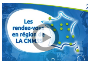
Les Rendez-vous en région reviennent le 4 juin 2019