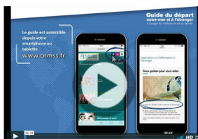
Le Guide du départ outre-mer et à l'étranger