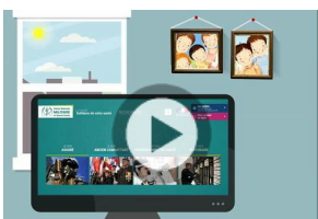
Demande en ligne de remboursement TDSHF